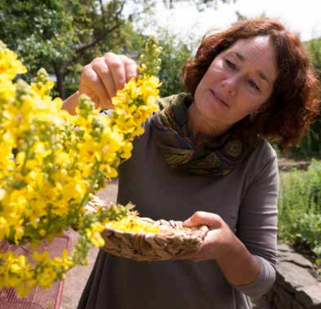
Bei ihren Führungen erklärt die Expertin nicht nur den Aufbau des Gartens und die Heilkraft der Arzneipflanzen, die Teilnehmer erhalten auch praktische Sammel- und Anwendungstipps

dem Barfußweg können gesundheitsbewusste Menschen ihre Sinne schärfen und den Kreislauf ankurbeln. Mit dem Arzneipflanzengarten, der nach dem Vorbild alter Heilpflanzengärten entstanden ist, informiert die Stadt über eine weitere Kneipp'sche Grundsäule.